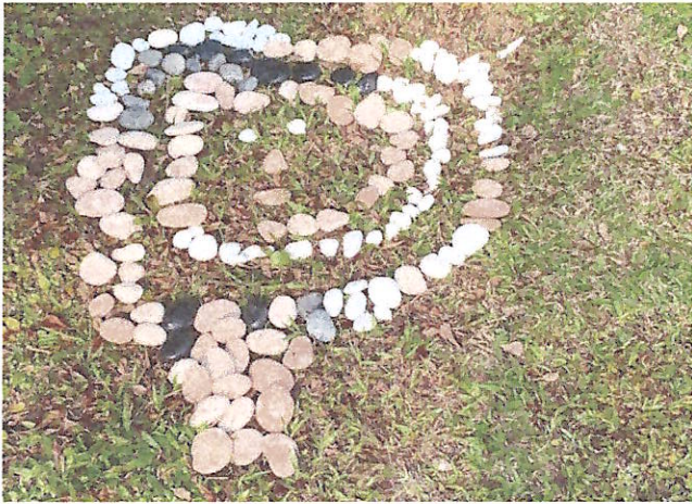
鬆散素材:專注力精細動作~石頭創作