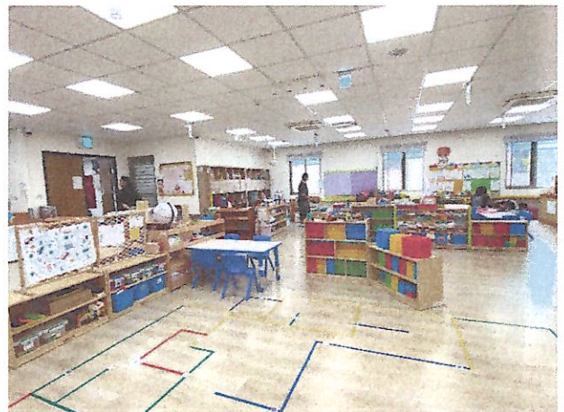
有機學習環境:學習區介紹~六大領域