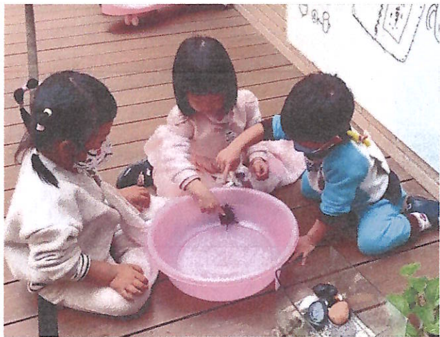
生命教育:愛護動植物與照顧~~飼養烏龜