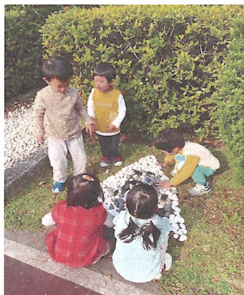
鬆散素材：石頭探索與合作學習~美感