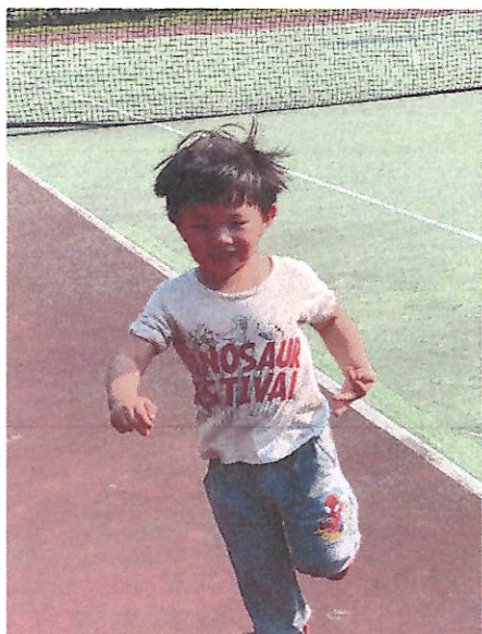
體能活動:感統訓練~~賽跑