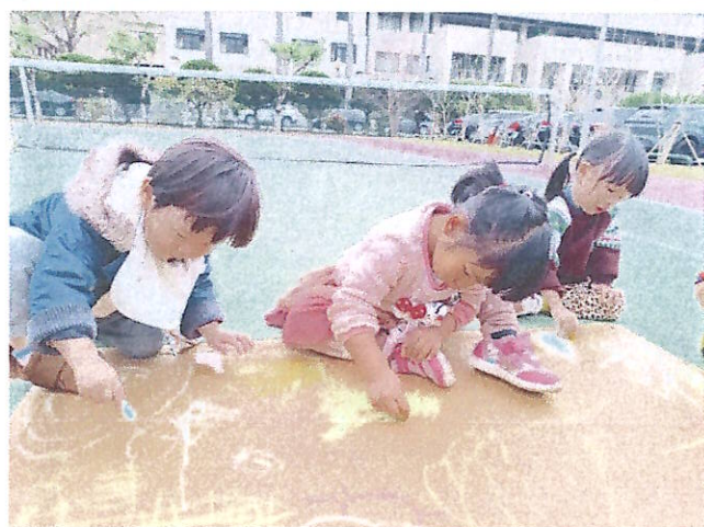
大地彩繪:合作學習~~創藝畫