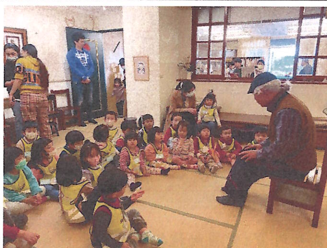
兒童哲學:楊爺爺說故事