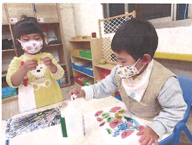
藝術創作:美感~~塗鴉撕貼創作畫