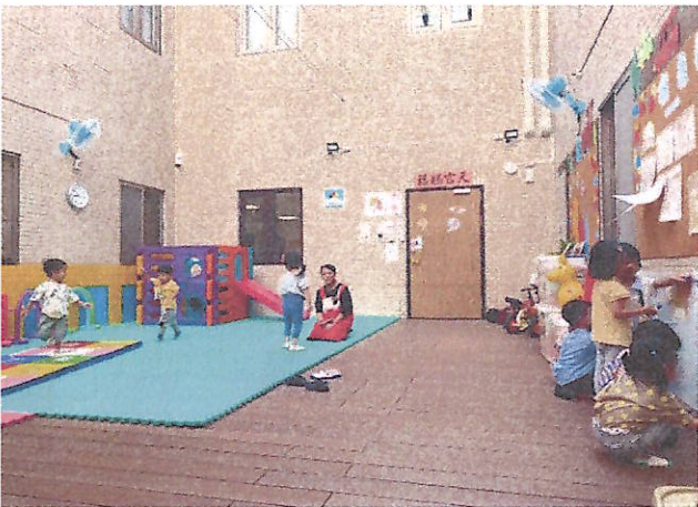
多元學習:藝術、體能、觀察與閱讀