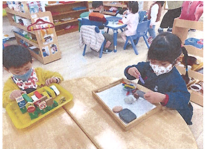
主題與學習區探索:數學、藝術