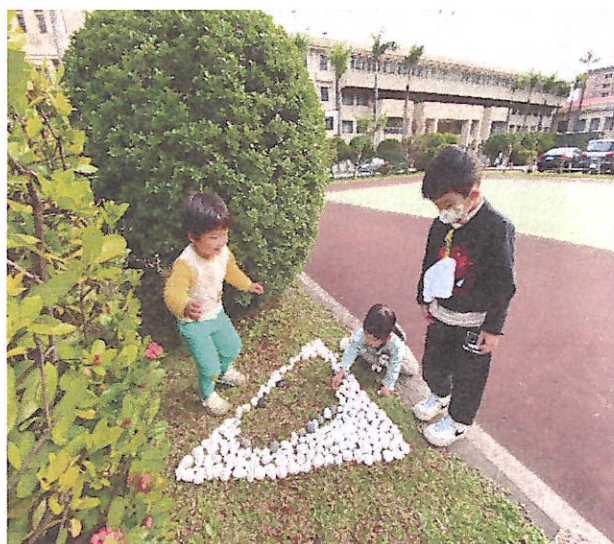
遊戲學習：快樂、合作與主動自主學習