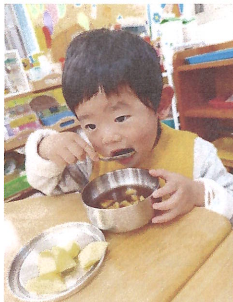
美食：營養點心~~紅豆湯元宵