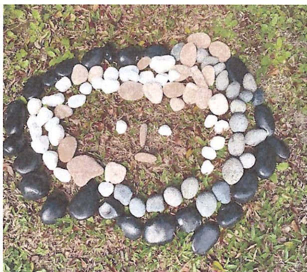
美感：訓練圖說能力~~藝術創作語言