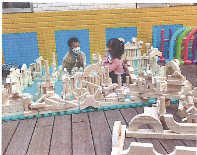
幾何積木建構:邏輯幾何概念~~拜登鐵塔