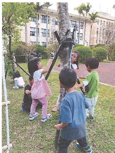
兒童藝術家:樹的彩繪