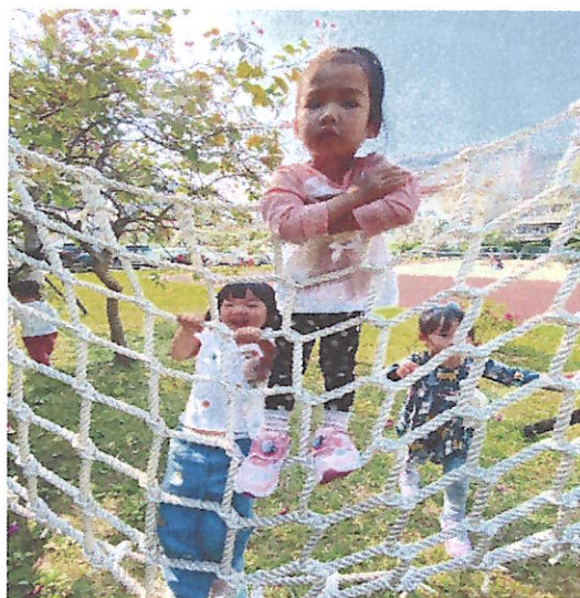
大肌肉活動:體能訓練~~攀繩索