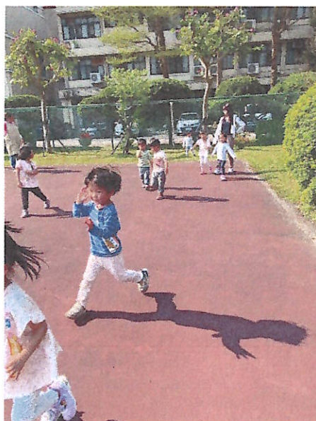
大肌肉活動:跑~跳~追