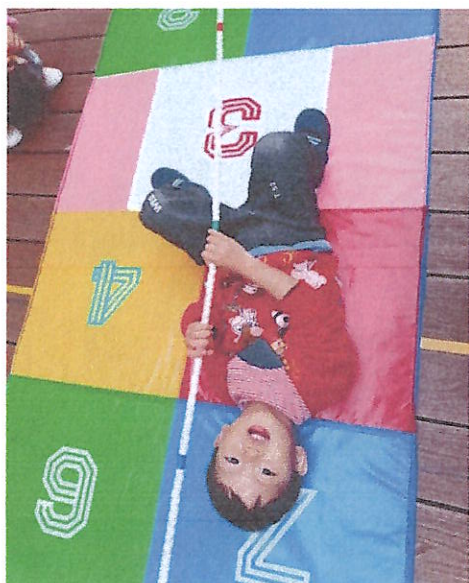
感統訓練：前庭發展