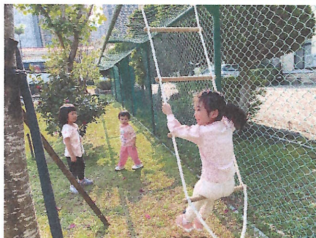
我們的遊戲:勇於探索~~盪鞦韆